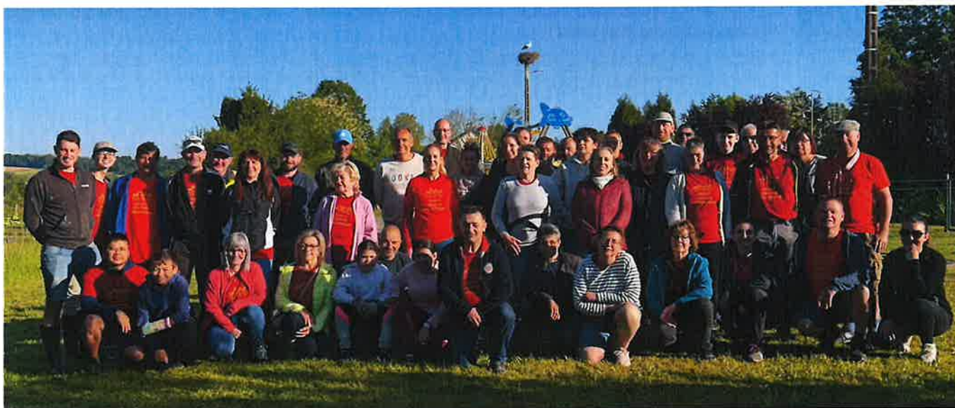
MAI & SEPTEMBRE 2025

Nous aurons d'ailleurs le plaisir de nous retrouver lors de la journée citoyenne du 30 mai prochain, de 7h30 à 13h00. Ce sera, comme pour les précédentes éditions, un beau moment de partage et d'engagement collectif en faveur de notre cadre de vie. La matinée se prolongera autour d'un apéritif et d'un repas convivial, dans la bonne humeur, comme on sait si bien le faire chez nous. Alors, venez nombreux, je compte sur vous.