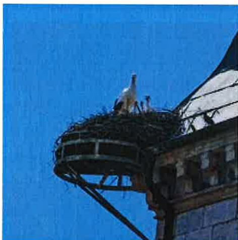
LES NAISSANCES DU PRINTEMPS