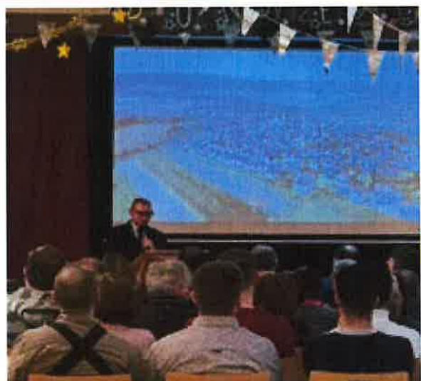
LES VŒUX DE LA MUNICIPALITE