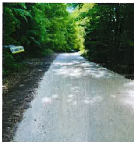
REFECTION DE CHEMINS