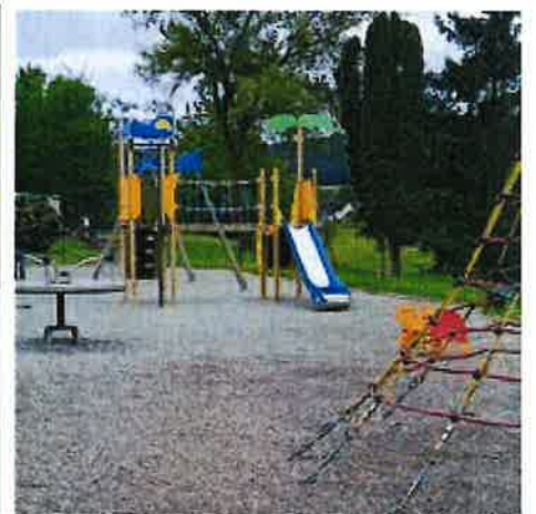
REPLACEMENT D'UN JEU A L'AIRE DE JEUX