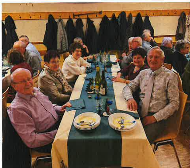
LE REPAS DE NOEL DES AINES