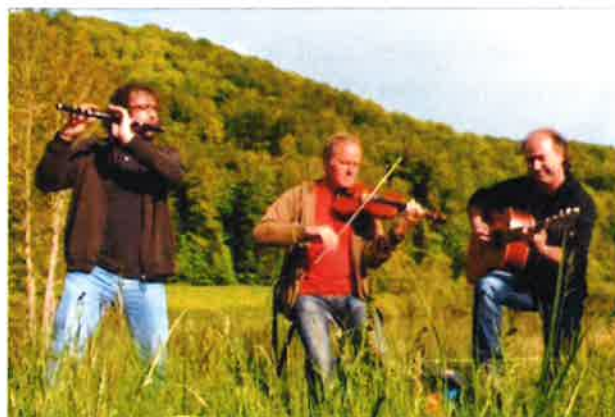
LES CHUM'S à Werentzhouse, dimanche 11 février à partir de 11 h

Mathieu vous présente la collection 2018 (lingerie, cosmétique...) au Bùrahüs à partir de 18 h. Faites-vous plaisir !